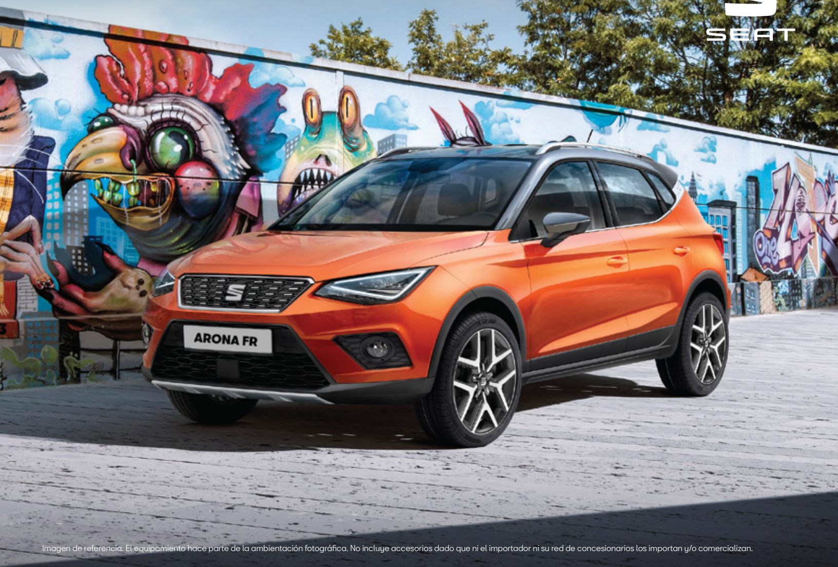
Imagen de referencia. El equipamiento hace parte de la ambientación fotográfica. No incluye accesorios dado que ni el importador ni su red de concesionarios los importan y/o comercializan.