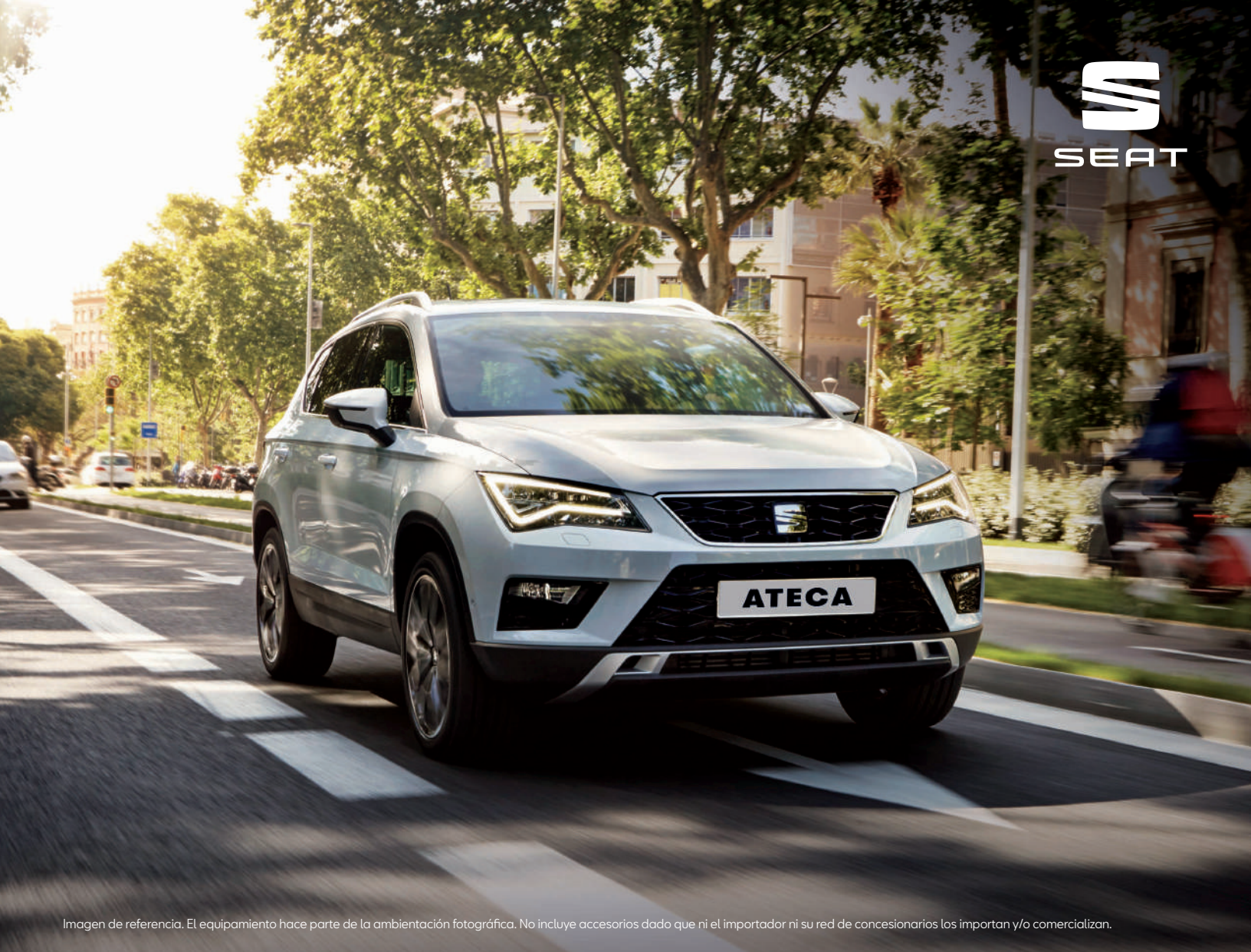
Imagen de referencia. El equipamiento hace parte de la ambientación fotográfica. No incluye accesorios dado que ni el importador ni su red de concesionarios los importan y/o comercializan.