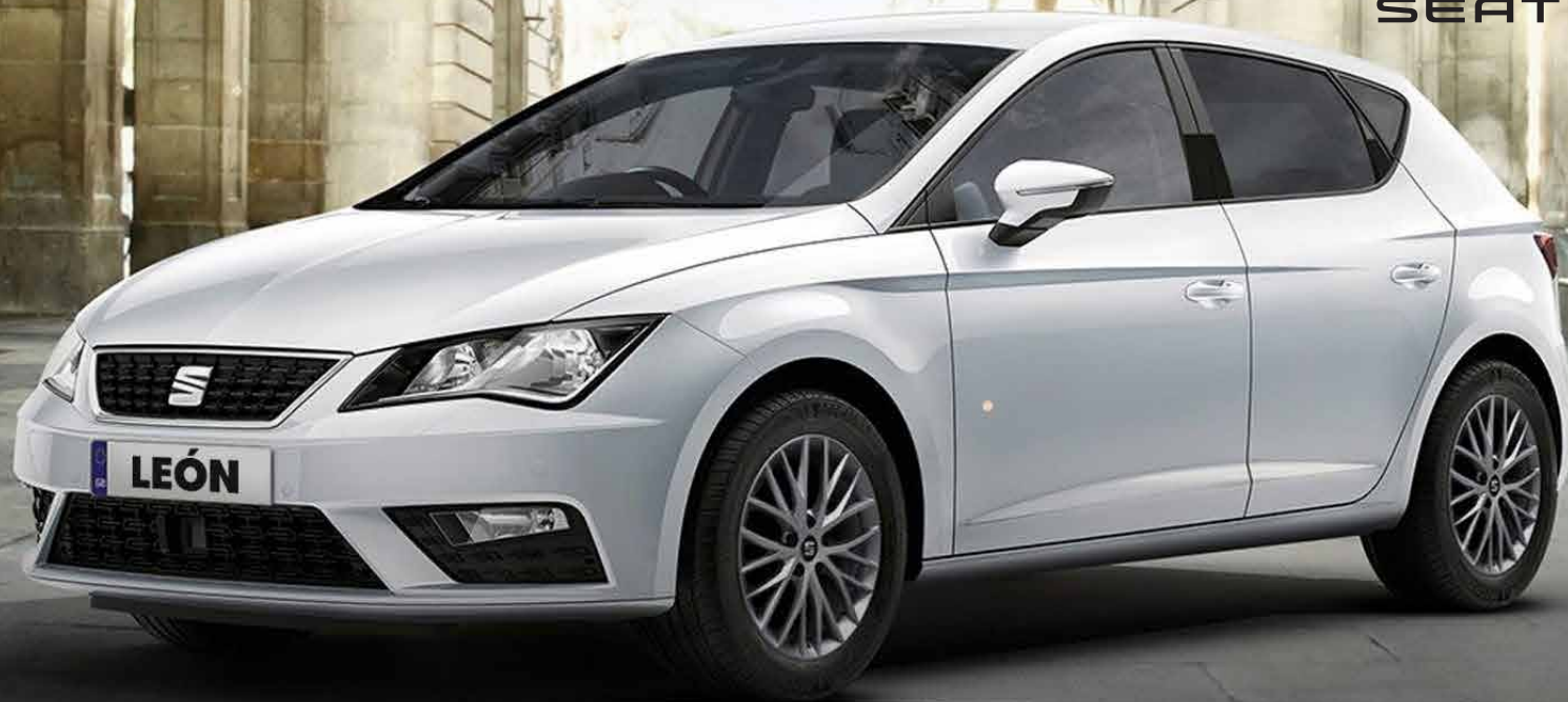
Imagen de referencia. El equipamiento hace parte de la ambientación fotográfica. No incluye accesorios dado que ni el importador ni su red de concesionarios los importan y/o comercializan.