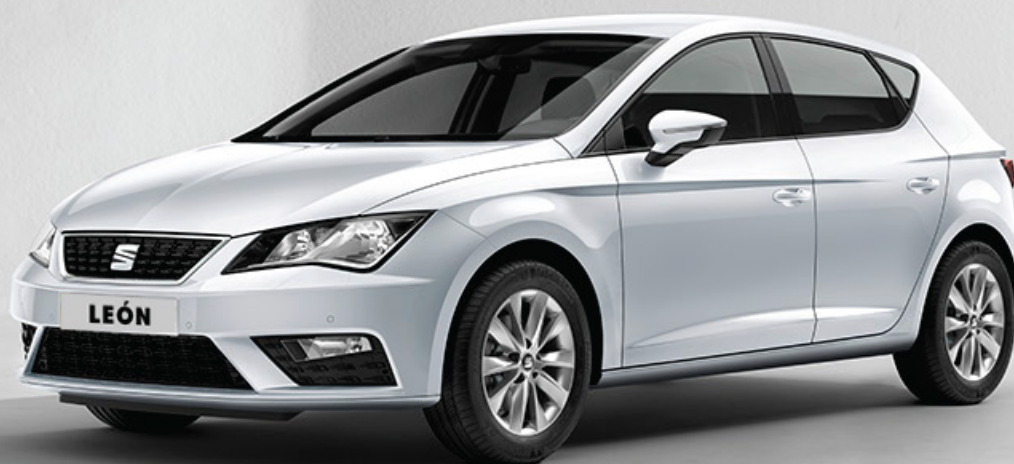
Imagen de referencia. El equipamiento hace parte de la ambientación fotográfica. No incluye accesorios dado que ni el importador ni su red de concesionarios los importan y/o comercializan.