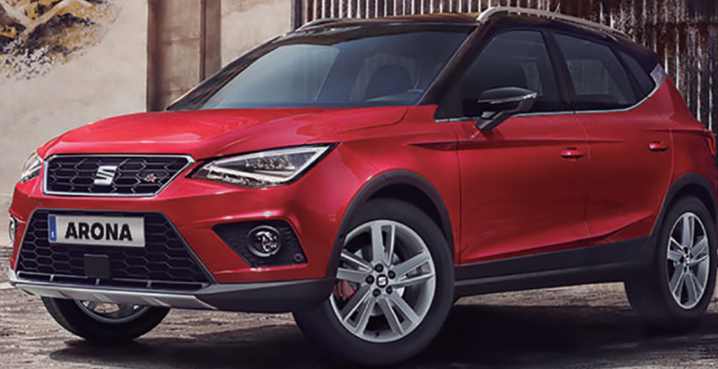
Imagen de referencia. El equipamiento hace parte de la ambientación fotográfica. No incluye accesorios dado que ni el importador ni su red de concesionarios los importan y/o comercializan.